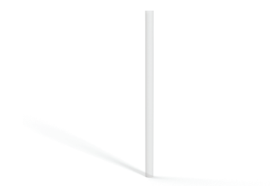
Verlengtuit 12 stuks per set Artikelnummer: 803010102