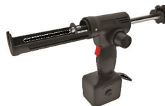
PowerMax kitpistool 380 ml (5:1) Artikelnummer: 803010205