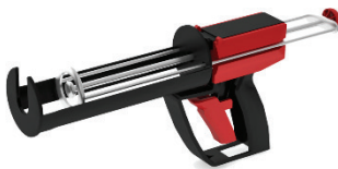
HandyMax kitpistool 380 ml (5:1) Artikelnummer: 803010202