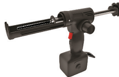
PowerMax kitpistool 380 ml (5:1) Artikelnummer: 803010205