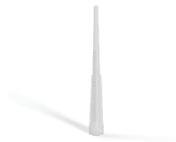
Mengtuit 380 ml 12 stuks per set Artikelnummer: 803010101