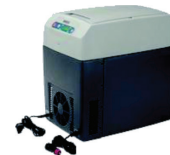
Temperatuur box WAECO TC 21FL Artikelnummer: 803010401