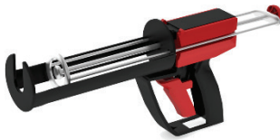
HandyMax kitpistool 380 ml (5:1) Artikelnummer: 803010202