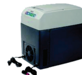
Temperatuur box WAECO TC 21FL Artikelnummer: 803010401